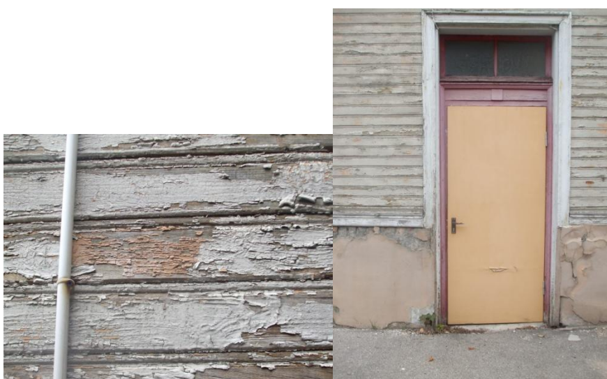
Dēļu apšuvums un ieejas durvis pagalma pusē