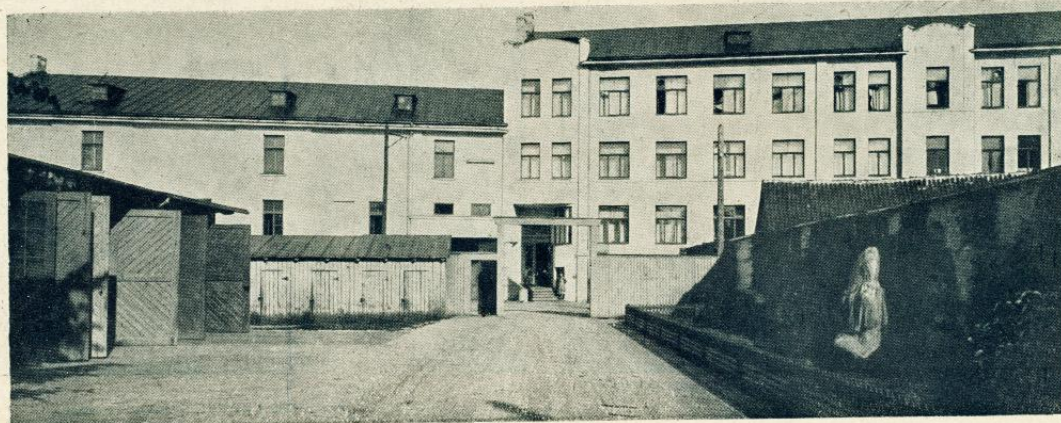
Fabrikas vispārējais skats.

A/S. «Maikapar» fabrika dibināta 1887. gadā, un pašlaik viņa ir viens no lielākajiem tehniski vislabāk nostādītiem tabakas rūpniecības uzņēmumiem ne vien Latvijā, bet arī visās jaunajās Baltijas valstīs. Gadā viņa izstrādā ap 700 miljonu papirosu, nepārtraukti nodarbinādama 300 strādnieku.