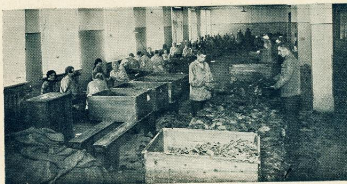
Tabakas šķirošana un maisīšana priekš papirosiem «Mokka».

Kad tabakas stāds izaudzis, resp. nogatavojies, no viņa novāc lapas, nolaužot tās no kātiņiem. Ievāktās lapas pēc tam žāvē un raudzē, un ne agrāk, kā gada laikā pēc tabakas ražas ievākšanas, tabaku var nodot pasaules tabakas fabrikām savu ražojumu izstrādāšanai.