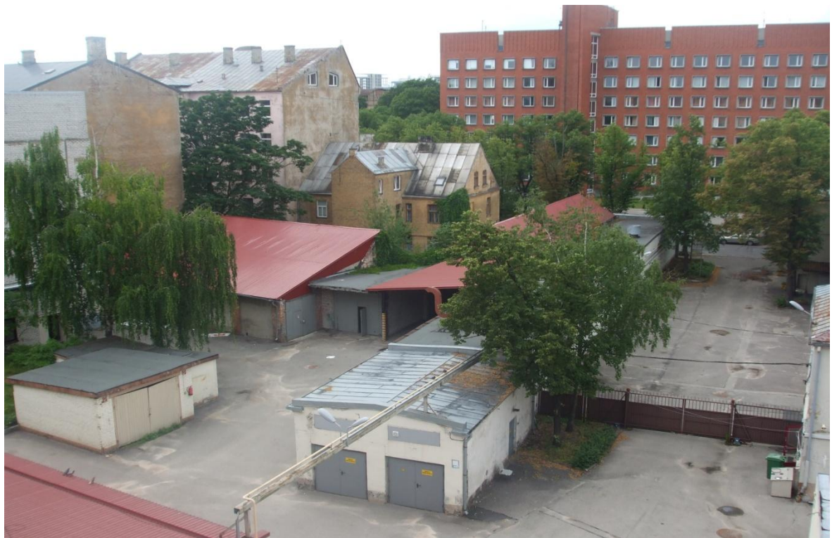
Rīga, Miera iela 58