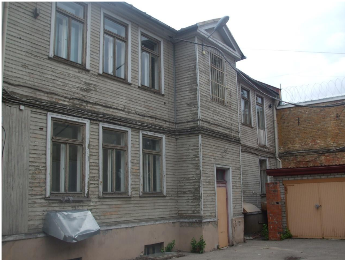
Liters 003 - pagalma fasāde